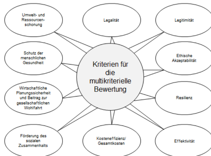
Abbildung 1: Kriterien für die multikriterielle Bewertung

Wir stellen einen multikriteriellen Ansatz zur Bewertung von Energiewende-Politik vor. Dieser Bewertungsansatz wurde im Rahmen des Kopernikus-Projektes „Energiewende-Navigationssystem“ (ENavi) im Arbeitspaket „Bewertung“ entwickelt (siehe Quitzow et al. 2018). Der Bewertungsansatz stellt im Rahmen des transdisziplinären Forschungsansatzes von ENavi die Schnittstelle zwischen der Forschung und der Diskussion mit gesellschaftlichen Akteursgruppen zu politischen Handlungsoptionen dar. Im Austausch zwischen Wissenschaftlerinnen und Wissenschaftlern aus unterschiedlichen Disziplinen sowie Akteurinnen und Akteuren aus der Praxis sollen Maßnahmenbündel konzipiert werden, die nicht nur die Erreichung der erklärten Energiewende-Ziele der Bundesregierung ermöglichen. Es sollen dabei auch andere wichtige Aspekte einer nachhaltigen Entwicklung berücksichtigt werden. Diese unterschiedlichen Aspekte sind in dem Bewertungsansatz in Form von zehn Bewertungskriterien verankert (siehe Abbildung 1).